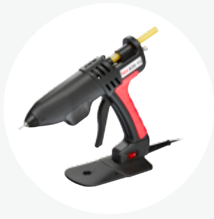
熱熔槍 TEC 820-12