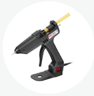
熱熔槍 TEC 305-12